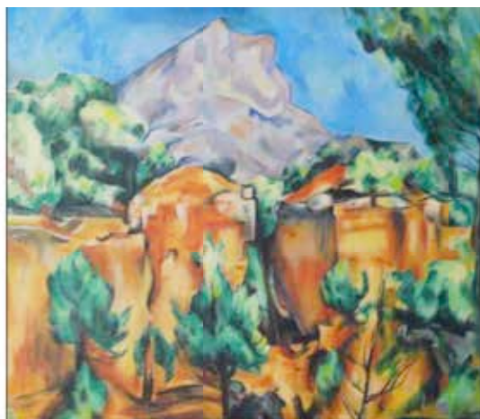
Cézanne. La montagne Sainte-Victoire

Nous partons de Saint-Maximin en bus jusqu'au pied de la montagne Sainte-Victoire. Je ne m'attendais à rien. Je n'avais pas les images des tableaux de Cézanne en tête. C'est une gloire locale de toute évidence. Les gens du coin sont fiers de leur montagne et des tableaux de l'artiste.